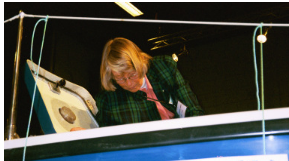
Vem hälsar på i Galatea?

Sedan var det slut och vi tog vår Utölimpa och lilla fyrhorn och åkte hem Annika i 1277 Jänta