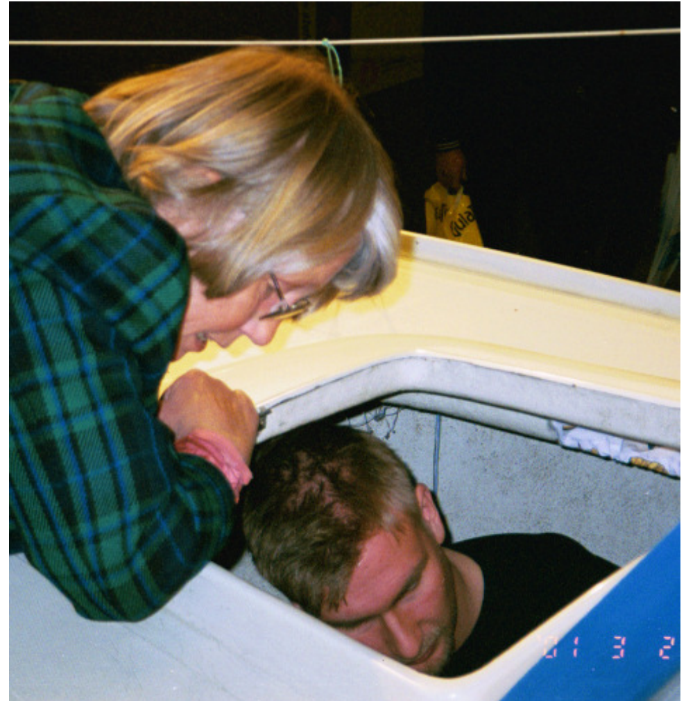
En trotjänare inspekteras.