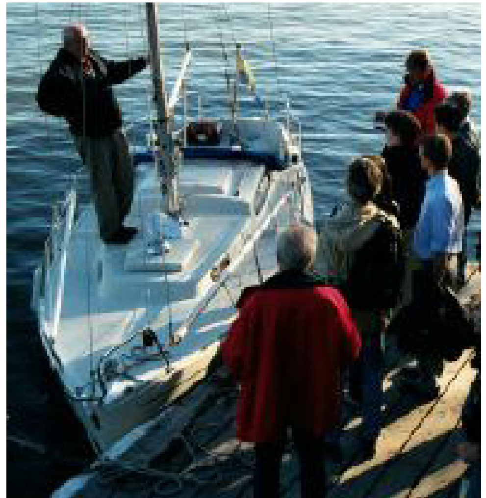
Riggträff i maj.