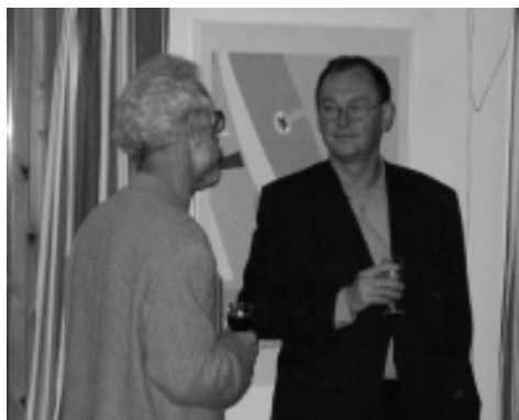
Lite "mingel".