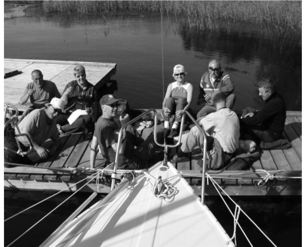
Sherry på bryggan.